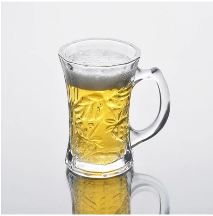
altura taza de vidrio blanco