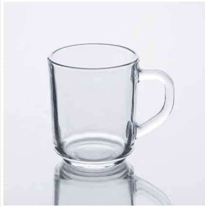
taza vaso de agua clara