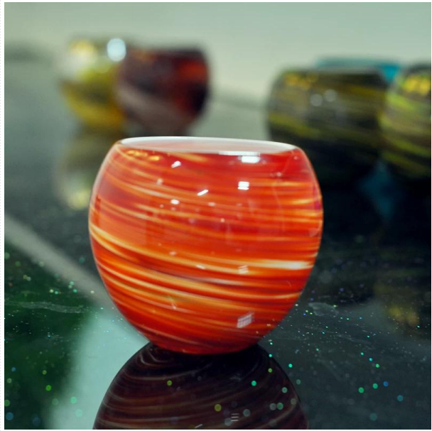
nuevo titular de vela de cristal