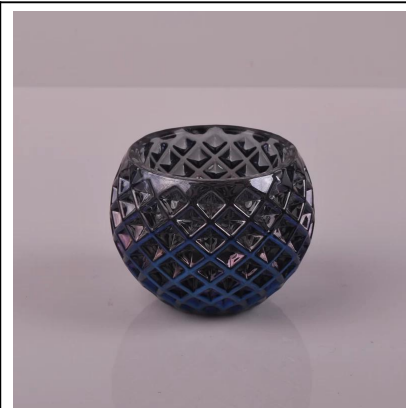
porta velas patrón tejido de vidrio