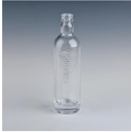
botella de whisky de cristal