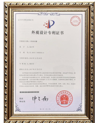
Patente no. : 201630655323.4