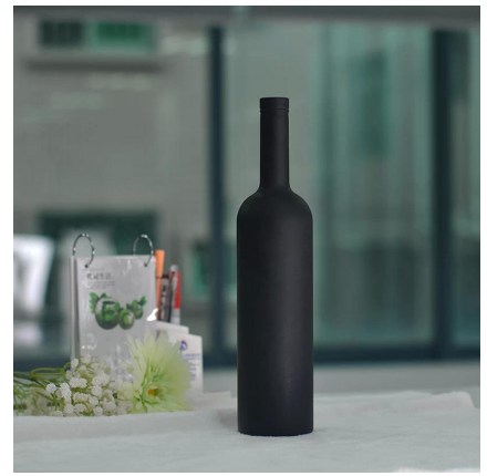
Vidrio spray botellas de vino rojo por mayor