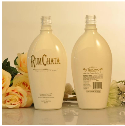
Botella de vidrio de vodka de alta calidad con la pintura blanca