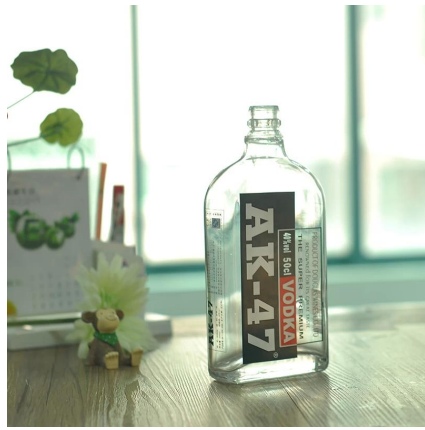
botella de vidrio de vodka