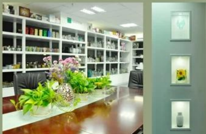
Demostración de la fábrica: