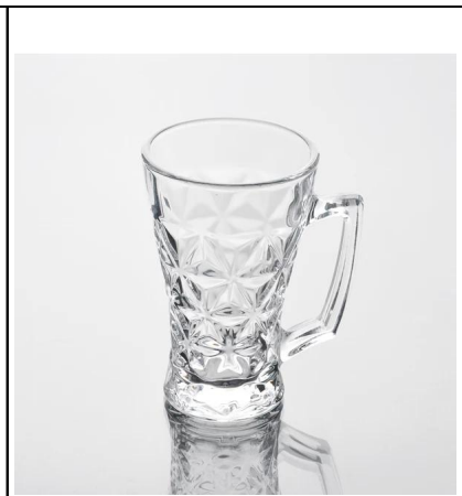
máquina hecha de vidrio de cerveza