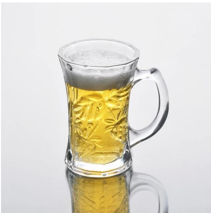
altura taza de vidrio blanco