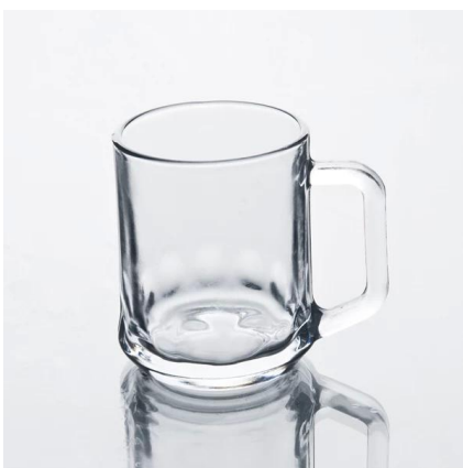
taza de cristal de agua clara