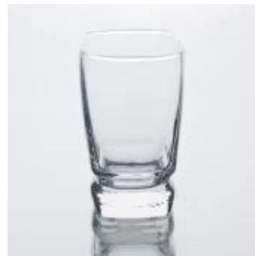
El último diseño de la taza de cristal