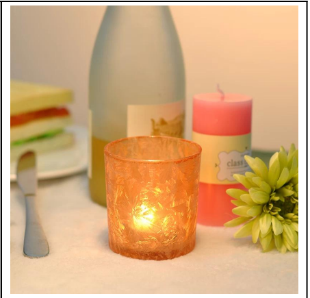
Los titulares del vidrio esmerilado de Vela votiva