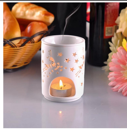
_diseño hueco vigilia de cerámica titular de la vela de la lámpara