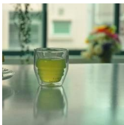
Taza de café Pyrex