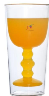
Copa de jugo de pared doble taza de vidrio de pared doble