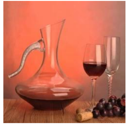
La calidad de la mano decantador de vino soplado