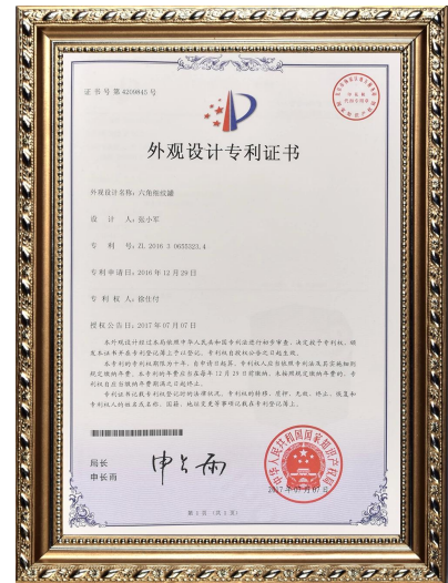
Nº de patente: 201630655323.4