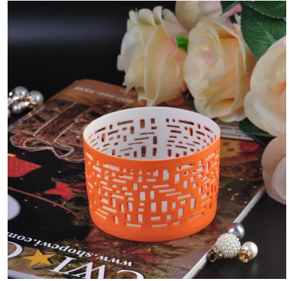
Color titulares votivas al por mayor