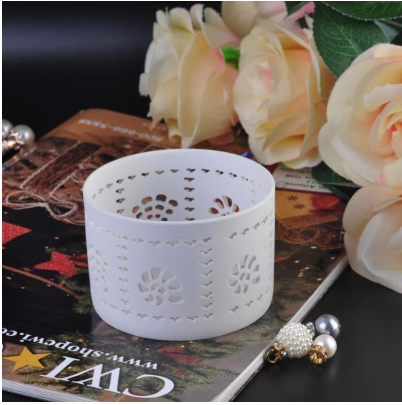
Portacandelitas elegante de la boda Decoración de cerámica vela titular