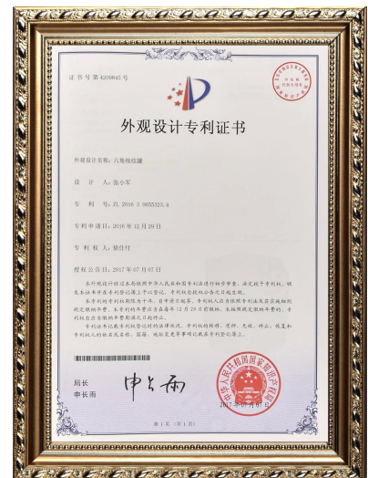
Patente no. : 201630655323.4