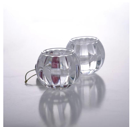
titular de la vela de la boda