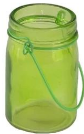
titular de la vela de la iglesia