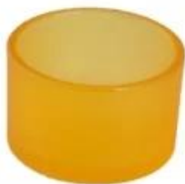
titular de la vela amarilla