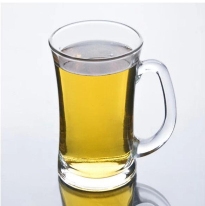
vidrio de la taza de cerveza