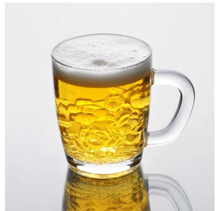
vaso de vidrio con mango