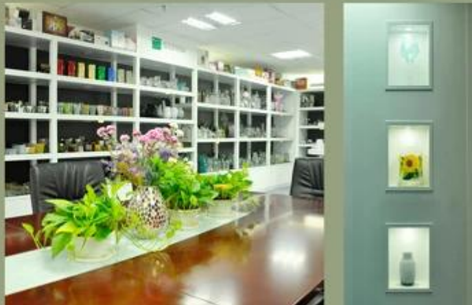
Demostración de la fábrica: