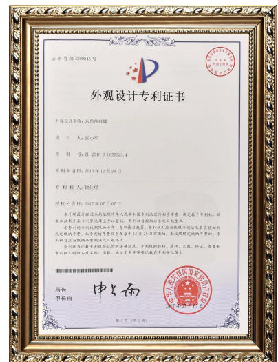
La patente no .: 20163065523.4