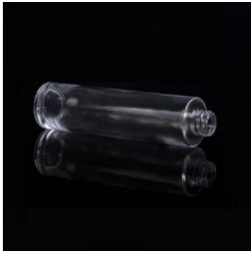
Botella difusor de cristal al por mayor de