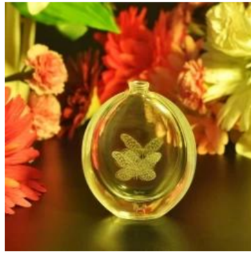
botella de perfume de cristal elegante corazón láser