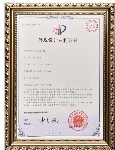
Patente No. : 201630655323.4