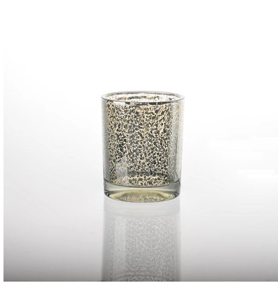
Sostenedor de vela rociado