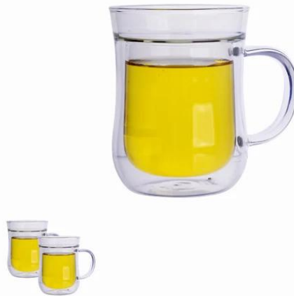
Nueva borosilicatado Doble acristalado vaso con la mano