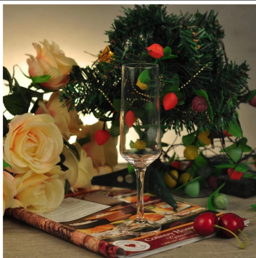
Champagne taza de cristal