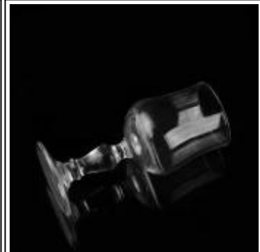
candelabro de cristal