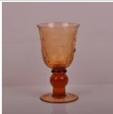
madre araña de cristal