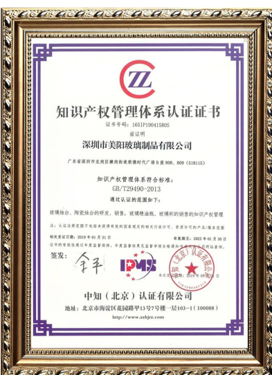
Propiedad intelectual corporativa N.º de patente: 201630655323.4