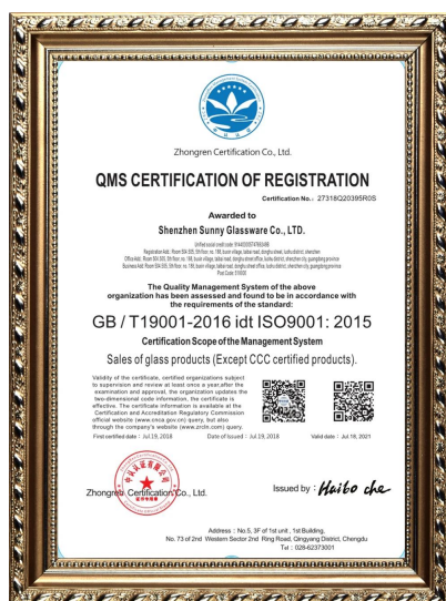
Norma ISO 9001:2015