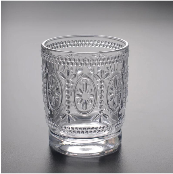
candelabro de cristal