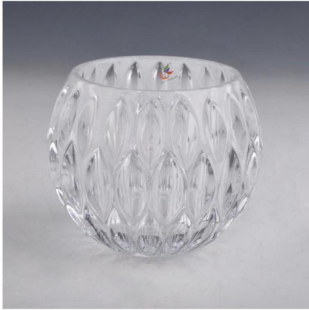
candelabro de cristal redondo