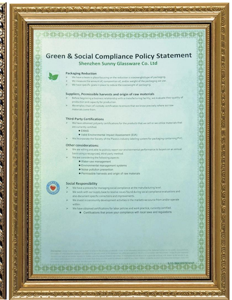
Responsabilidad verde y social Declaración de Policy