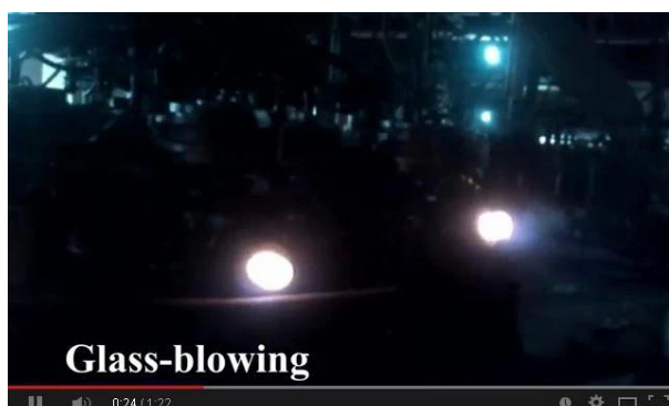
Tecnología de soplado de la máquina

Por la presente, vea nuestro video en línea de producción, bienvenido a visitarnos en el sitio.