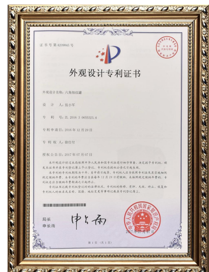
Patente No. : 201630655323.4