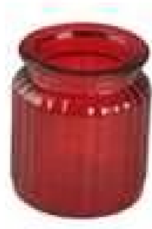
rocie vidrio vela jArkansas