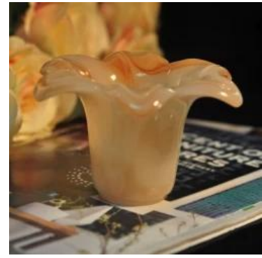
Forma de la flor de cilindros de jade de color ámbar sostenedor tarro vela vela vidrio decorativo