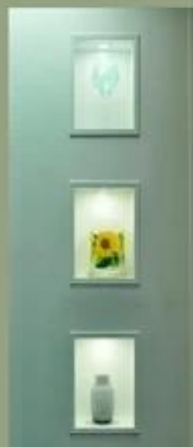
Visita a la fábrica: