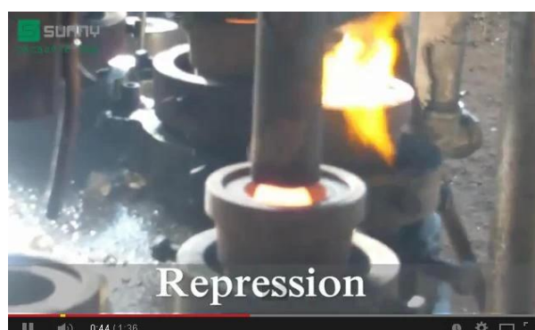
Tecnología de prensa de máquina