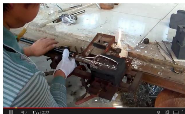
Tecnología soplada a mano