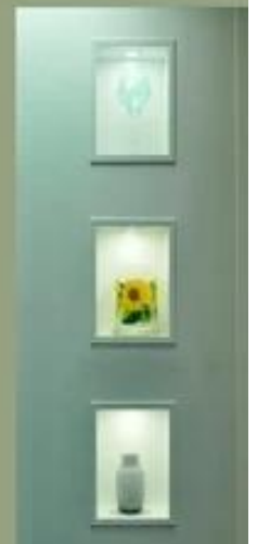
Demostración de la fábrica: