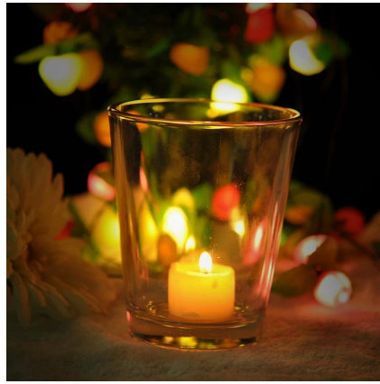
Altos porta velas claras V Shape