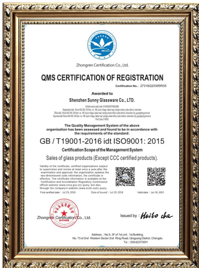
Norma ISO 9001:2015