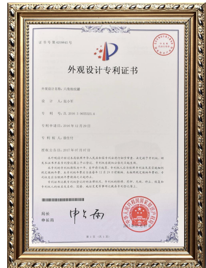
Nº de patente: 201630655323.4