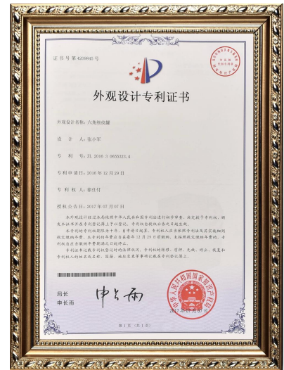
Patente no.: 20163065532.4