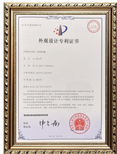
Número de patente: 201630655323.4