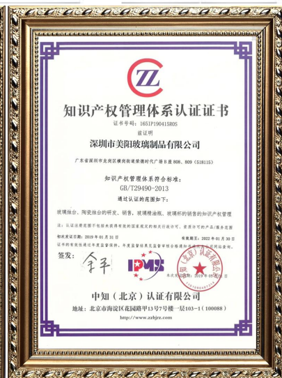
Propiedades intelectuales de la empresa