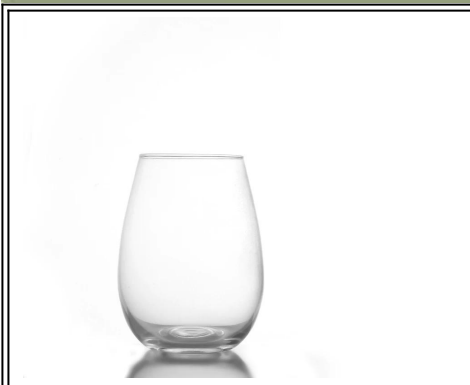
máquina abastecido sin tallo soplado del vidrio de vino