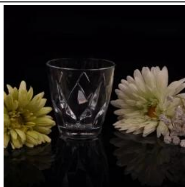
Vaso de whisky personalizada