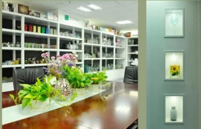
Demostración de la fábrica: