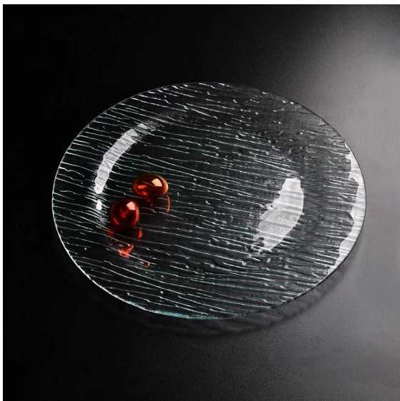
alrededor de la placa de cristal claro