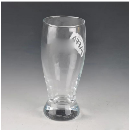
vidrio de la taza de cerveza