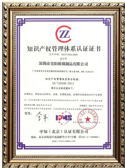
Propiedad intelectual de la empresa