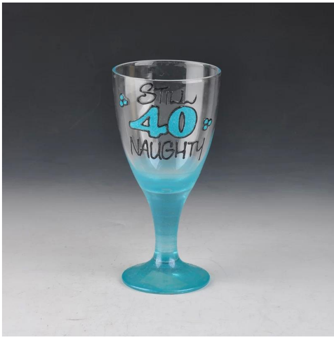
pintado vaso de margarita mano