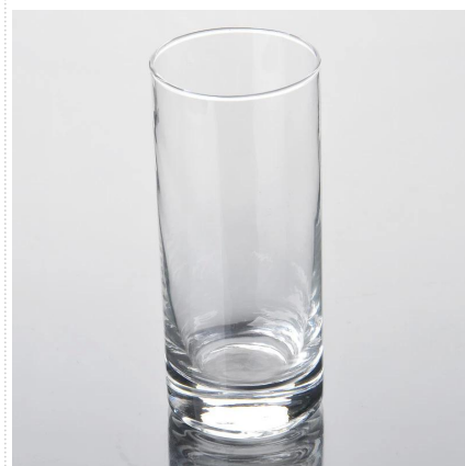
Simple taza vaso de cristal claro