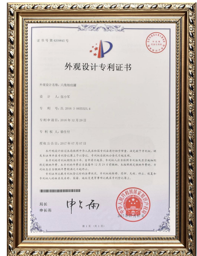
Patente No. : 201630655323.4