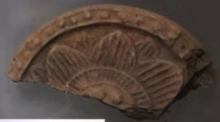
瓦当 Eaves of tiles

宋(公元960-1279年) In the Song Dynasty (960-1279 A.D.) 传世品 From ancient times