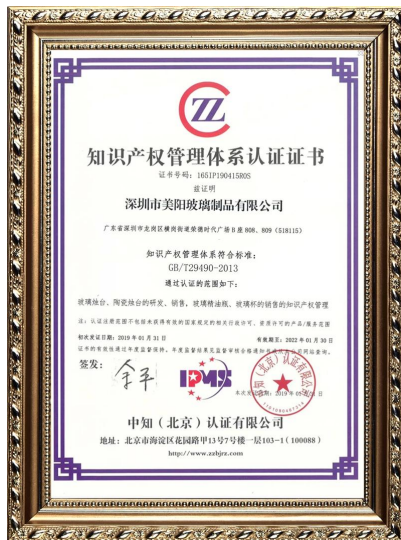
Propiedad intelectual de la empresa