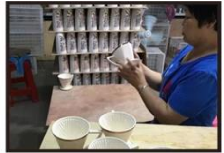
Inspection the decal product