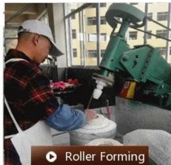
▶ Roller Forming