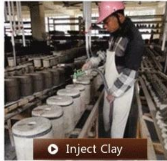
▶ Inject Clay