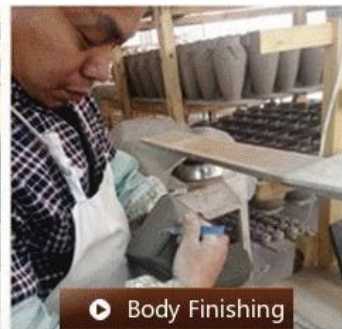
▶ Body Finishing