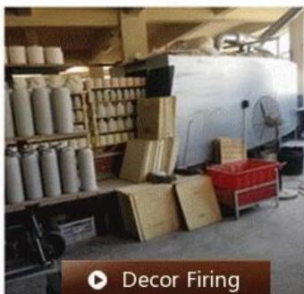
▶ Decor Firing