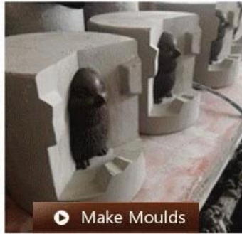
▶ Make Moulds