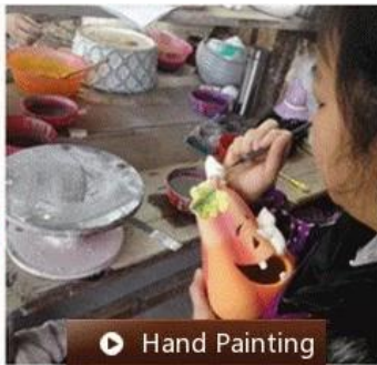
▶ Hand Painting