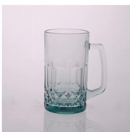
18 Unzen Glas-Bierkrug