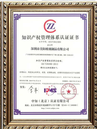
Intellektuelles Eigentum von Unternehmen Patent Nr.: 201630655323.4